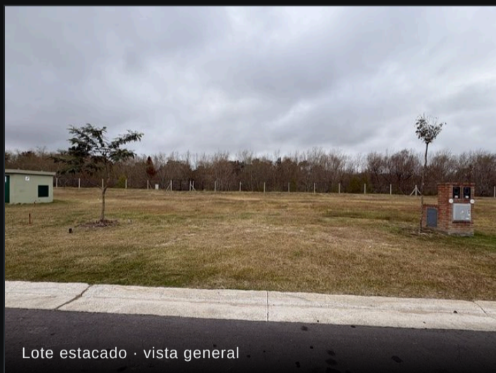
Lote estacado · vista general