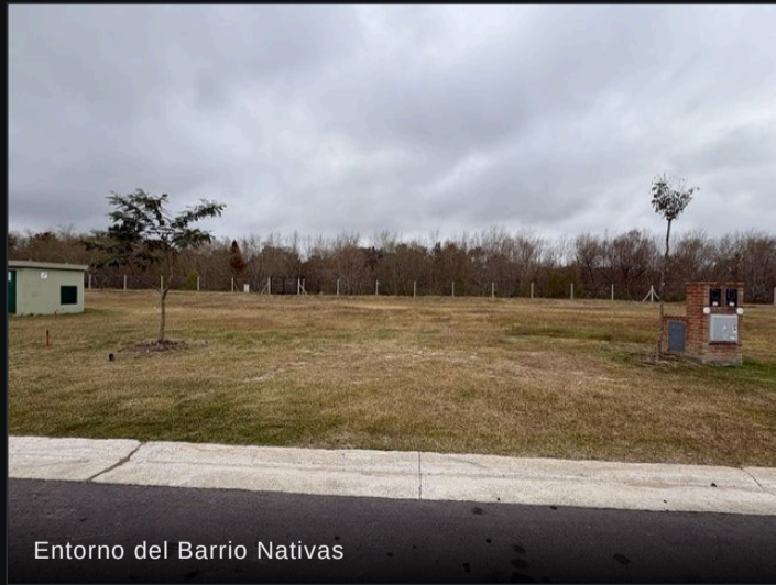
Entorno del Barrio Nativas