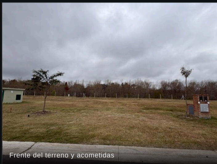
Frente del terreno y acometidas